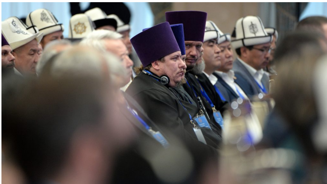
2019-жылдын 21-ноябрында Бишкек шаарында өткөн «Православие жана ислам – дүйнөлүк диндер» эл аралык конференциясы.

Белгилей кетчү нерсе, мамлекеттик-конфессиялык мамилелер жаатындагы акыркы окуялар мамлекеттик саясаттын дал ушул моделди ишке ашырууга багытталгандыгын көрсөтүп турат (2018-2040-ж.ж. КР өнүктүрүүнүн улуттук стратегиясы). Ошентсе да, Кыргызстандын көз карандысыздык мезгилинин ичинде аталган чөйрөдөгү саясат бир нече жолу өзгөрүп, бул абал анын өзгөрүлмө жана күтүүсүз экендигин ырастайт.