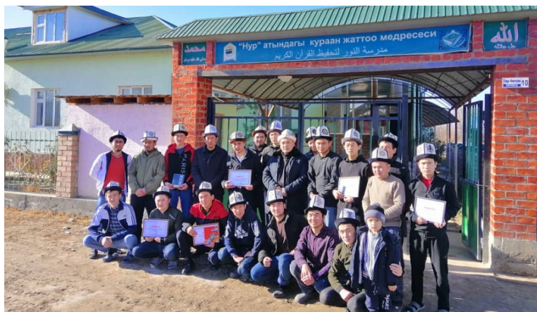
Баткендеги медреселердин биринин окуучулары.

Бул макала IWPR Central Asia медиа-уюму “Азаттык” радиосу менен кызматташтыгынын алкагында даярдалды. Макаланын түп нускасы azattyk.kg веб-сайтында жарыяланган.