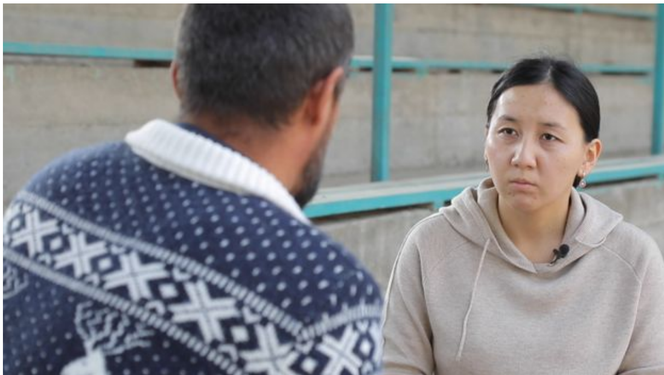
Image captionВсе герои просили не называть их настоящим имен и не показывать лиц

сильно разочаровал. Те, за кого я приехал сражаться, боролись друг против друга. Я не хотел участвовать в этом. Я понял, что никого не спасу, и мне пришлось вернуться”.