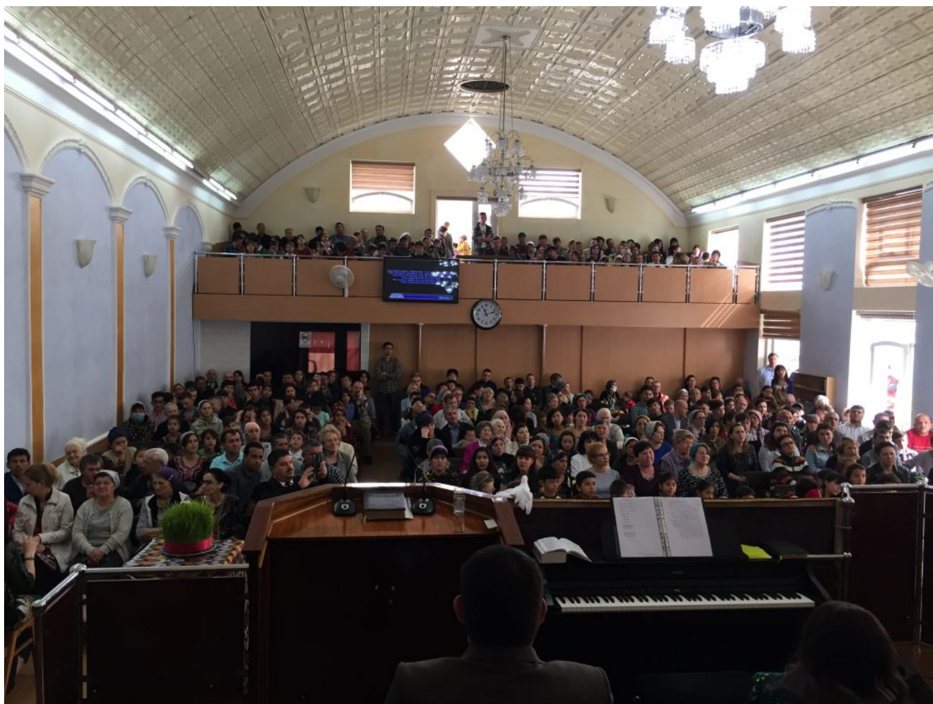
Воскресное богослужение.