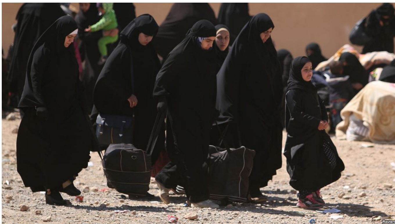
Женщины, бежавшие из города Ракка, Сирия. Апрель 2017 года.