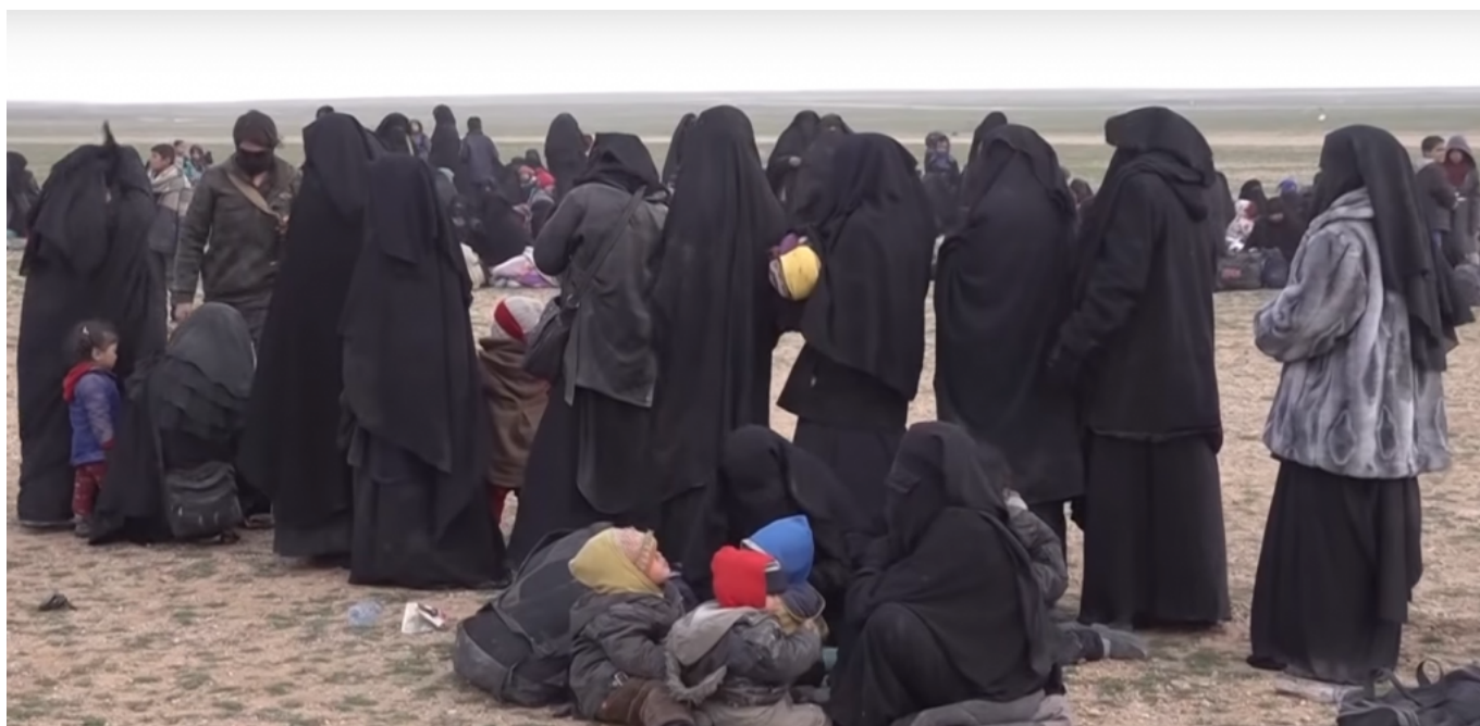
Беженцы из Сирии. Среди них есть граждане стран Центральной Азии.

«Нас вместе с множеством других женщин из Дагестана и Кыргызстана держали в многоэтажных домах. Мы слышали стрельбу, но не видели никого, кто получил ранения. Я год там пробыла, но вестей от мужа не было».