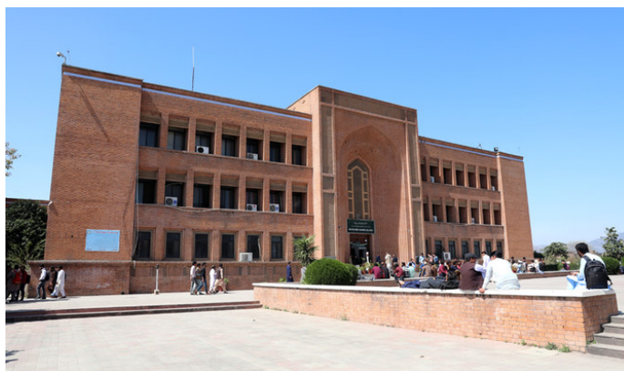
Кампус исламского университета в Пакистане.

Многие верующие, исповедующие ислам, получили религиозное образование в вузах Египта, Саудовской Аравии, Турции, Малайзии, Иордании, Пакистана. Другие же прослушали 4-месячные либо годовые курсы в Индии и Бангладеше. Обычно такие курсы многие проходят, когда выезжают на даават (исламские проповеди) в мечетях и медресе тех стран. Но никто не может сказать точной статистики лиц, получивших образование в вузах или на курсах за границей.