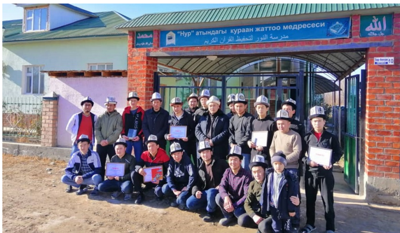
Ученики одного из медресе в Баткенской области.

Данный материал подготовлен в рамках сотрудничества IWPR Central Asia и Радио "Азаттык". Оригинал публикации доступен по этой ссылке .