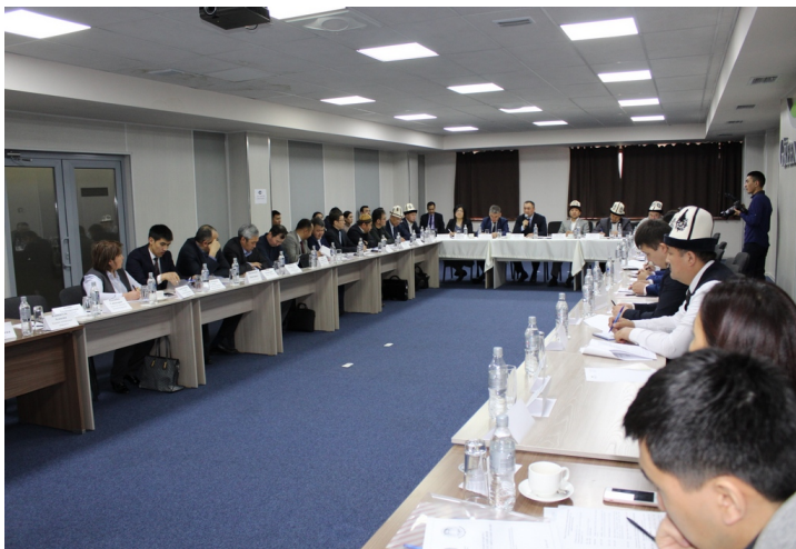
Обсуждение религиозного образования в Кыргызстане, организованное исследовательским центром "Булан институт".

В исследовании аналитической организации «Булан институт» отмечается высокий риск вовлечения молодых ребят из Кыргызстана, выехавших за рубеж для получения религиозного образования, в сети радикальных экстремистских организаций и получение образования в учебных заведениях, где искажают суть религии.