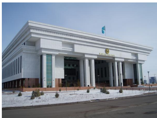
Верховный суд Казахстана.

И здесь следствие с судом ухватились за «спасательный круг»: ранее подсудимый наблюдался у психиатра, что позволило вместо оправдания признать мужчину «особо опасным» для общества и направить его на принудительное лечение.