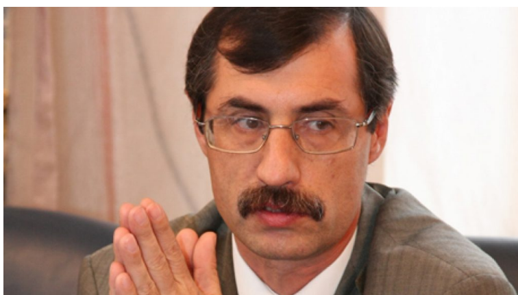
Евгений Жовтис.

“Национальный совет общественного доверия, он сейчас пытается продемонстрировать определенные позитивные намерения в отношении изменения ряда статей в законодательстве и ряда практик, которые уж очень сильно возмущают активную часть общества и постоянно критикуются правозащитниками внутри страны и международными организациями. Другой вопрос, что не очень понятно каким образом это будет реализовываться, потому что эта статья, наравне с некоторыми другими законами, это такой ресурс ставки командования, который используется точечно в тех случаях, когда действующая власть видит себе угрозу в мобилизации или в каких-то отдельных людях, которые будоражат общественное мнение”, - говорит он.