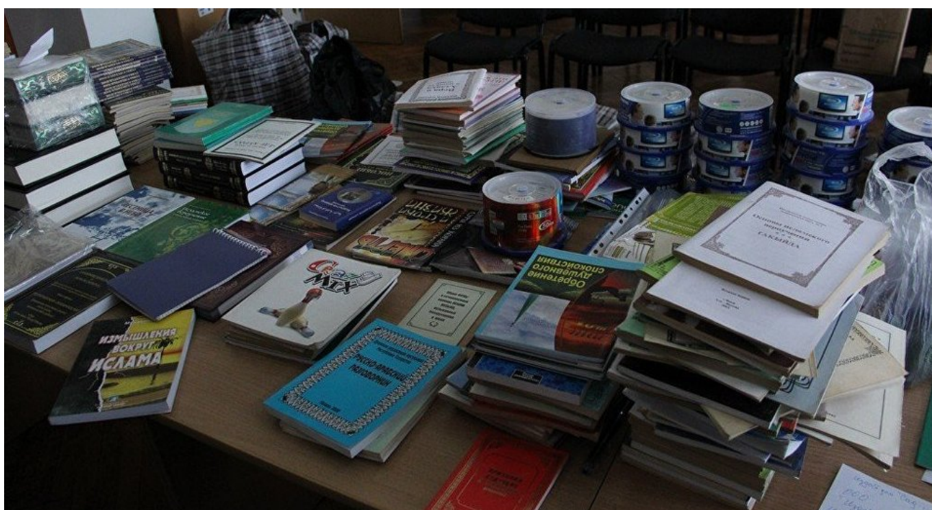
Изъятые запрещенные материалы МВД Кыргызстана.

Анализ существующих медиастратегий по предотвращению распространения идеологии насильственного религиозного экстремизма в Интернете указывает на необходимость внедрения мер, направленных на устранение причин повышенного внимания к пропагандистским материалам и роста доверия в обществе.