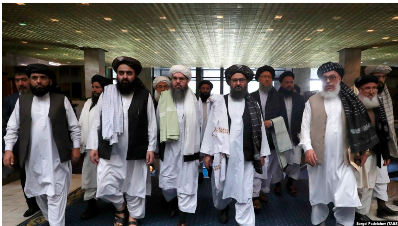
Ҳайати Толибон дар Маскав.

Албатта, то андозае ин андеша ва тахмину гумонҳо дуруст аст. На танҳо ба афкори созмонҳои тундрав барои мардуми кишварҳои минтақа ҳам таъсир расониданашон мумкин аст. Лекин ман боз такрор мекунам, ки мо ҳоло гуфта наметавонем, ки Толибон сад дар сад ба сари қудрат меоянд ва дар Афғонистон худи мардум ақидаҳои онҳоро пурра қабул доранд ва онҳо дар сари қудрат мемонанд. Такрор ҳам шавад агар даҳлат ва ҳамкориҳои онҳо бо чунин нерӯҳо сурат гирад, ман фикр намекунам, ки ҷомеаи ҷаҳонӣ дар ин масъала ором шинад ва даст ба иқдом назанад, ё ки бетарафӣ зоҳир наояд.