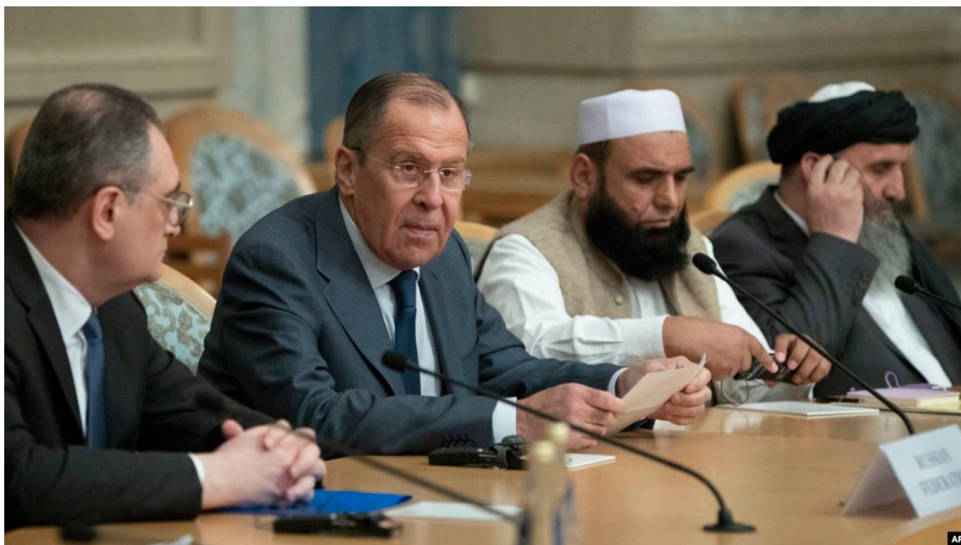
Музокирот бо Толибон дар Маскав: Акс аз Reuters

Толибон дар фаъолияти худ то ҳоло кадом кори шоистаеро ба анҷом нарасонидаанд. Ин барои ҳамагон маълум аст, аммо ҷомеаи ҷаҳонӣ ба раҳбарии Амрико маҷбур аст, ки иқдоми сулҳро пеш гирад. Чаро Русия ҳамчунин пешниҳодро матраҳ кардааст? Русия барои ҷилавгирӣ аз хатари ДОИШ дар Афғонистон ва пеш аз ҳама кишварҳои Осиёи марказӣ ин иқдомро пеш гирифт.