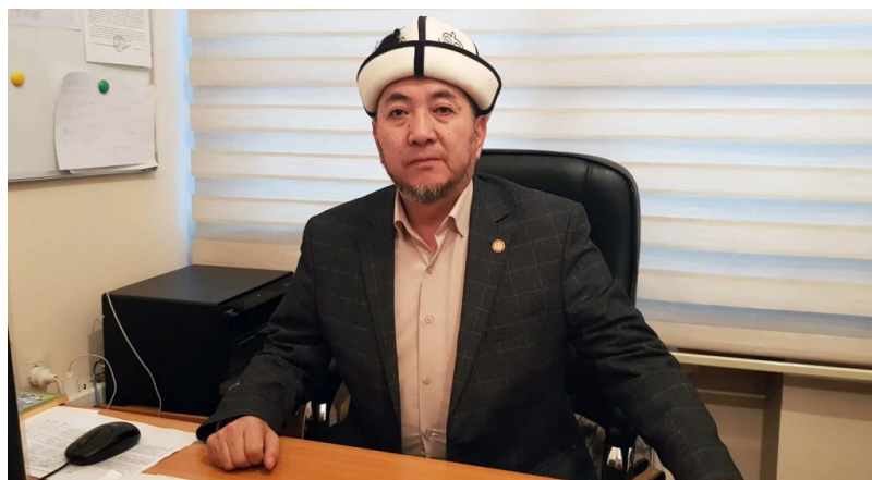
Представитель муфтията за то, чтобы все дети получали светское образование.

«Да, есть факты, когда родители уверяют, что будут обучать детей дома и там же изучать Коран. Но они только Кораном и ограничиваются – не учат