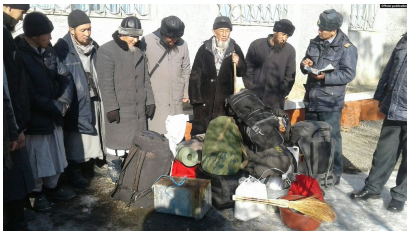
Последователи запрещенного движения “Йакын инкар” (запрещена на территории КР решением суда).

«Когда к нам от мэрии поступило сообщение, что мальчик четвертый месяц не посещает школу, мы взяли ситуацию под контроль. Узнали, что глава семейства уехал на даават, а супруга и сын находятся одни дома. Мать мальчика была согласна с тем, что он должен посещать школу, но без ведома мужа не решилась отпустить его», – дополнил собеседник.