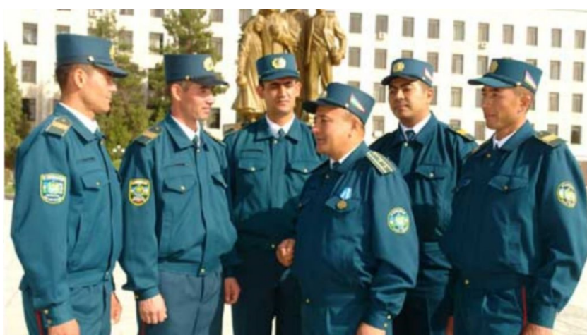
Сотрудники милиции Узбекистана. Иллюстративное фото.

Даже в период карантина по COVID-19, запрещенные идеи продолжают распространяться и поражать умы непросвещенной части мусульманской общины Узбекистана. Так, 32-летний житель Навоийской области Узбекистана, следуя правилам карантина оставаться дома, “заразился” в интернете идеями радикально-экстремистских организаций (РЭО). Как сообщило МВД Узбекистана 7 апреля, молодой человек открыл профиль на Odnoklassniki.ru на вымышленное имя и через этот аккаунт получил доступ к различным запрещенным интернет-ресурсам. Загрузив проповеди духовного лидера запрещенной в Узбекистане МТО молодой человек стал распространять их среди своих “виртуальных” друзей.