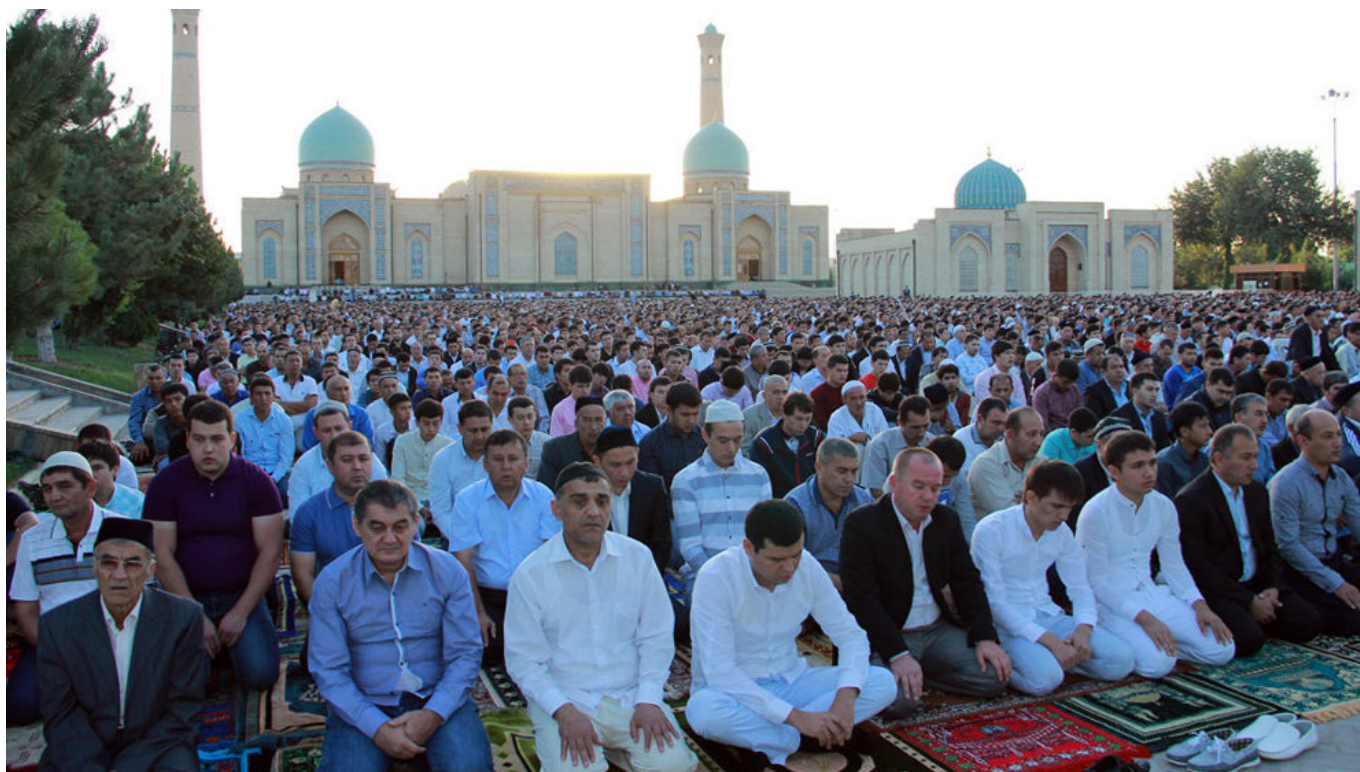
Узбекистанцы во время молитвы.

В стране реализуются несколько пилотных проектов, направленных на противодействие радикализации и даже дерадикализации. Один из таких проектов был реализован в Алмазарском районе Ташкента. В этом районе местным УВД был создан консультативный центр, в котором работали опытные теологи, исламоведы, имамы. В центр совершенно анонимно мог обратиться любой житель Ташкента и задать специалистам любой вопрос, связанные с толкованием Корана или положений ислама. Родители спрашивали о поступках детей в тех или иных сложных жизненных ситуациях, когда молодые люди путались в религиозных догмах и были готовы принять ошибочные решения. Были посетители, которые приводили на консультацию своих друзей, наслушавшихся «джихадистских» идей в интернете. Очень интересный и важный эксперимент с хорошим позитивным эффектом.