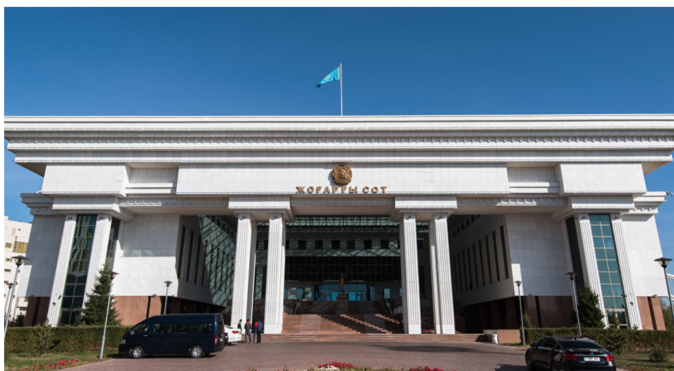
Қазақстанның Жоғарғы соты.

Бұл жағдайда тергеу мен сот бірігіп “тал қармады”: бұрынырақ айыпталушы психиатр бақылауында болған, осыдан соң ақтаудың орнына оны қоғам үшін “аса қауіпті” деп танып, мәжбүрлі түрде емдеуге жіберді.