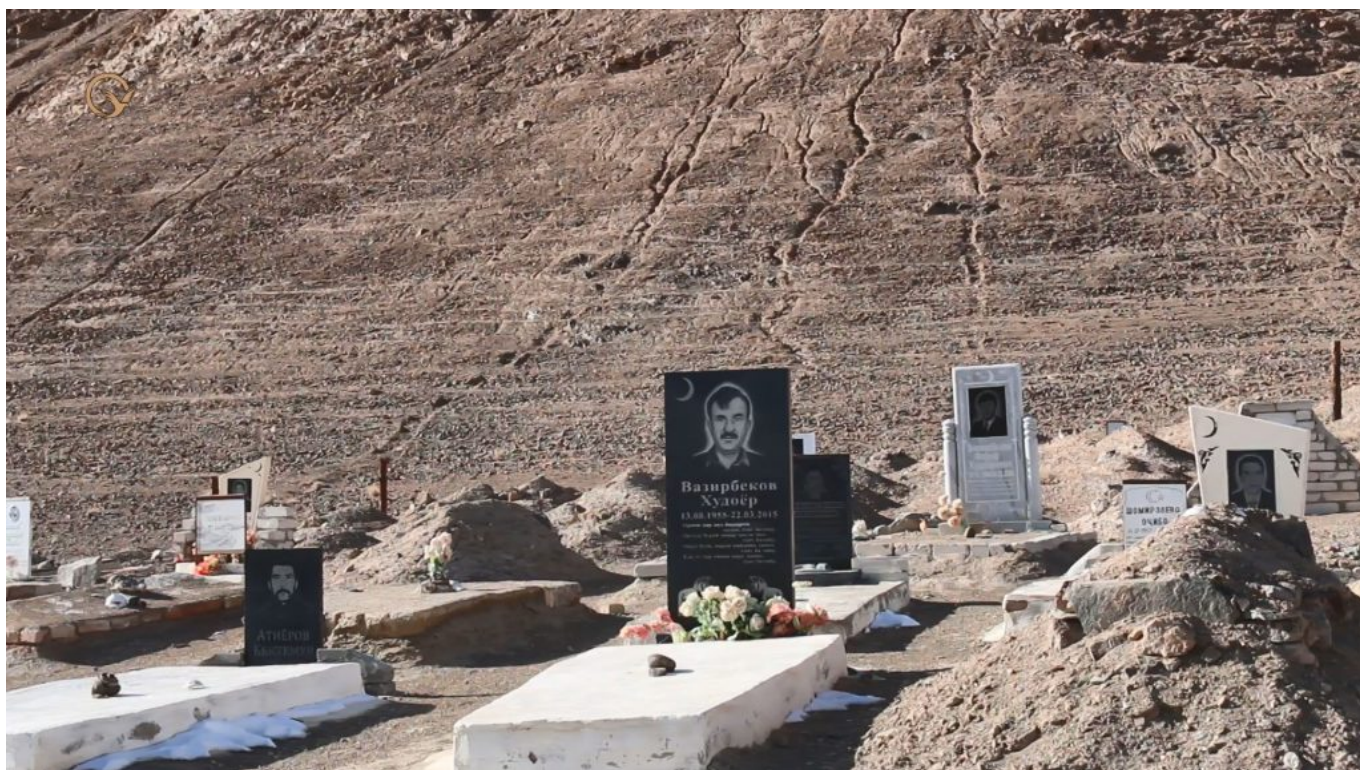
Совместное кладбище кыргызов и таджиков в Мургабе.

Совместные браки в Мургабе не особо распространены. Но если подобное случается, союз представителей двух народов происходит по обоюдному согласию и одобрению родственников с обеих сторон.