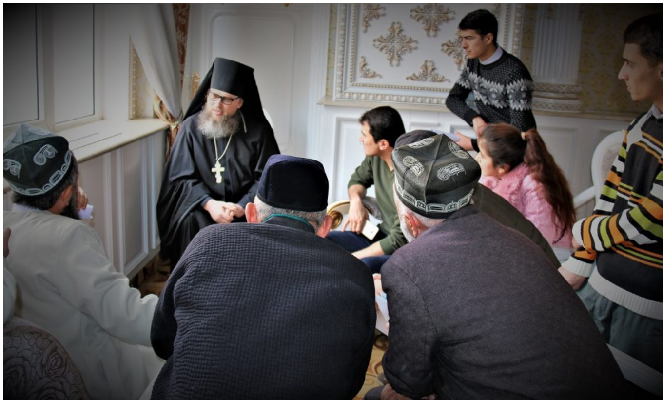
Намояндагони динҳои гуногун дар Душанбе дар фестивали байнидини "Тоҷикистон хонаи мо", ки аз сӯи намояндагии Институти инъикоси ҷанг ва сулҳ дар мушорикат бо Кумитаи дин, танзими анъана ва ҷашну маросими назди Ҳукумати Ҷумҳурии Тоҷикистон доир карда шуд.

чустуҷӯи гунаҳгорон, даъвати раҳбари харизмотик ва ҳатто низоъи муқаррарии маишӣ.