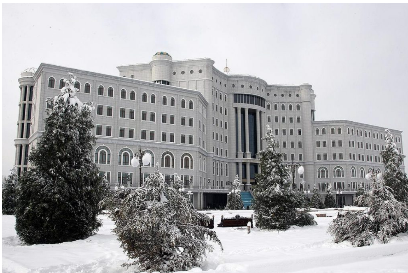
Дар Китобхонаи миллии Тоҷикистон “гӯша”-и Арабистони Саудӣ мавҷуд аст, ки онҷо курсҳои роғони забони арабӣ амал мекунанд.

Дар ҳамин ҳол, дар Китобхонаи миллии Тоҷикистон “гӯша”-и Арабистони Саудӣ фаъол аст, ки ҳаводорон метавонанд роғон забони арабӣ омӯзанд. Ба гуфтаи муштариёни гӯшаи мазкур, ҷавонони зиёде ба ин курсҳо меоянд, ки ба таваҷҷуҳ доштани насли ҷавон ба забони арабӣ далолат мекунад.